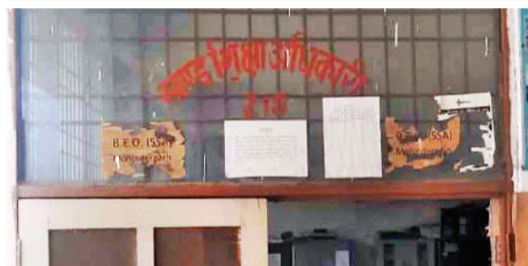
महेन्द्रगढ़। खंड शिक्षा अधिकारी कार्यालय।