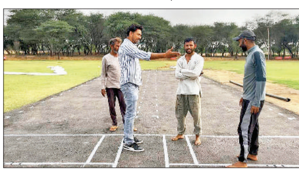
नारनौल। क्रिकेट टूर्नामेंट की तैयारियों में लगे कर्मचारी।

जिले के गांव नीरपुर राजपूत (अटेली) के सम्राट पृथ्वीराज चौहान स्टेडियम में स्वीप एक्टिविटी के तहत होने वाले दिन-रात क्रिकेट मैच के लिए सभी प्रकार की तैयारियां पूरी कर ली गई हैं। इस मैच के सबसे ज्यादा डंपर इसी मार्ग पर चलते हैं। यह डंपर एवं बड़े-बड़े ट्राले, ट्रैक्टर आदि ओवरलॉड कारोला-खातौली होते हुए धौलेड़ा-मेघोत बिजा से होते हुए