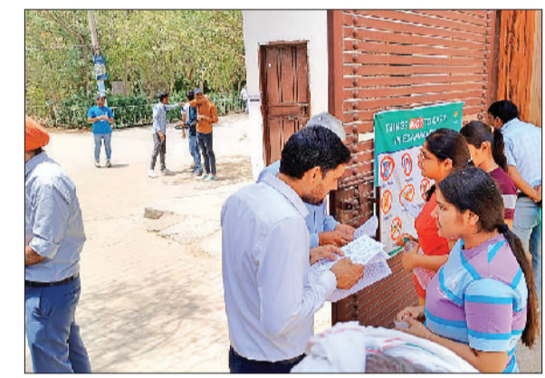
नारनौल। यूरेका स्कूल में बने परीक्षा केंद्र पर रोल नंबर चेक करते हुए।

मेडिकल एंट्रेस एजाम की तैयारी में भावी एमबीबीएस चिकित्सकों ने प्रातः 11 बजे ही परीक्षा केंद्रों पर पहुंचना शुरू कर दिया