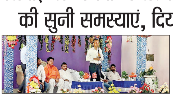
नांगल चौधरी