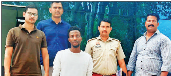
नारनौल। पुलिस गिरफ्त में आरोपित।