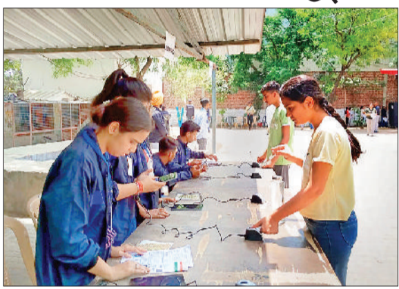
नारनौल। नीट परीक्षा में फिंगर प्रिंट का मिलान करते हुए।