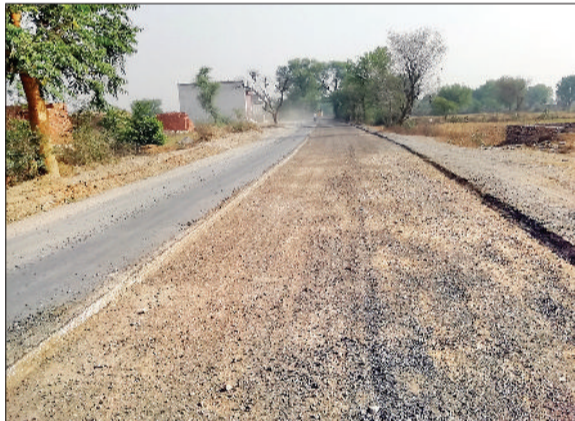
नारनौल। पीडब्ल्यूडी विभाग ने उखड़ना शुरू किया धौलेड़ा सड़क मार्ग।

इस मार्ग पर माइनिंग एवं स्टोन क्वेशर काफी संख्या में होने के कारण जिले में सर्वाधिक चलते हैं डंपर, जिस कारण बार-बार टूटती रहती है तारकोल वाली सड़क