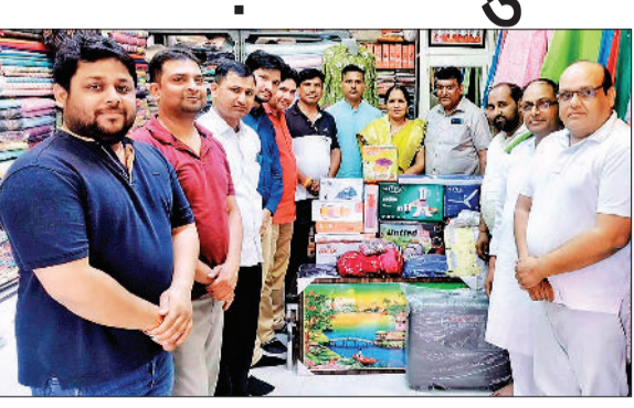
नारनौल। शादी में दिए जाने वाले सामान के साथ ग्रुप के सदस्य।